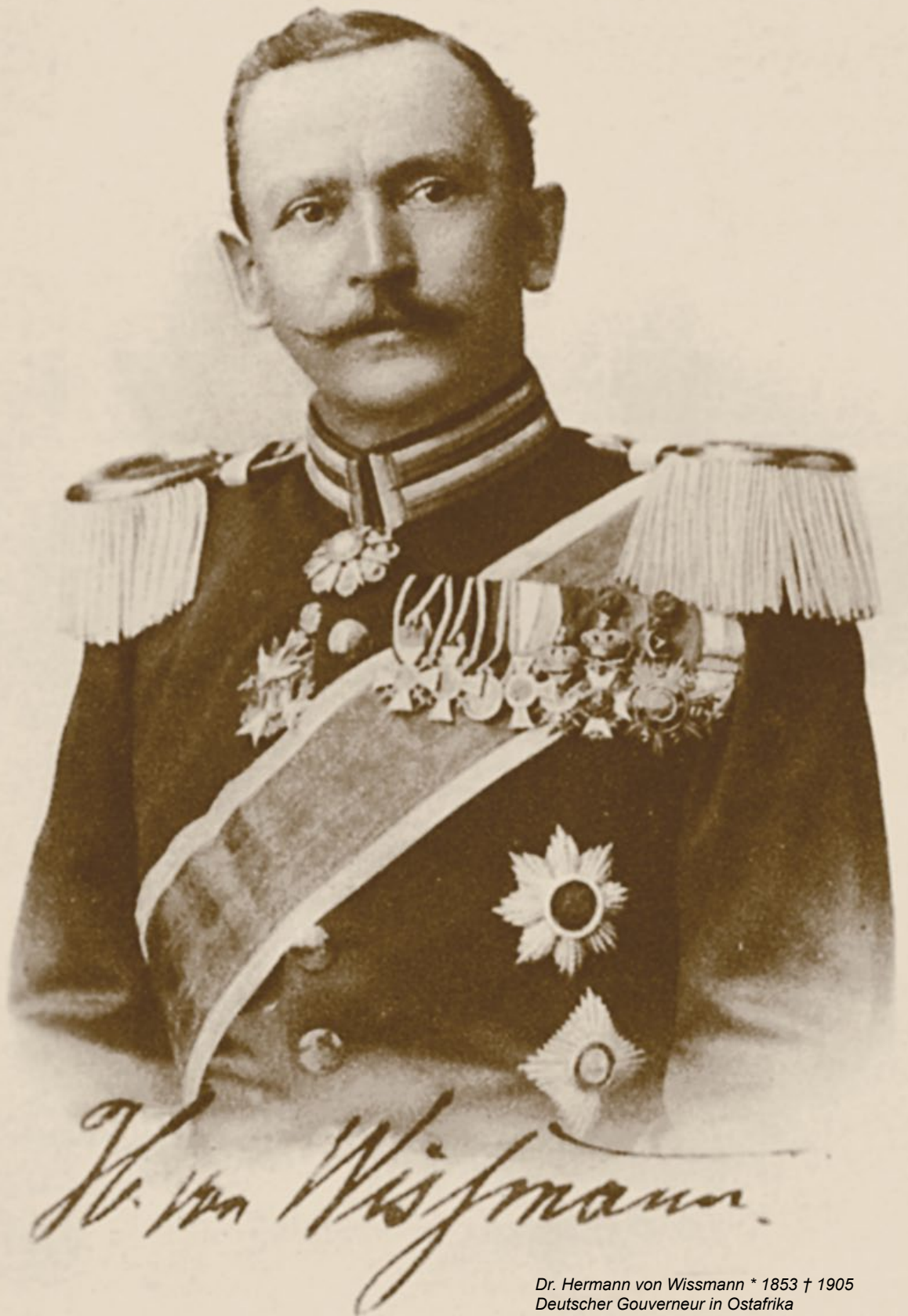
Dr. Hermann von Wissmann * 1853 † 1905 Deutscher Gouverneur in Ostafrika