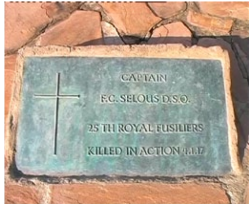
Grabplatte von F.C. Selous, der im 1. Weltkrieg bei Beho Beho fiel. Nach ihm erhielt das Reservat seinen heutigen Namen.

Das Mohoro Schutzgebiet wurde von der britischen Kolonialverwaltung, die nach dem ersten Weltkrieg die deutsche Kolonie Ostafrika übernahm, Anfang der 1920er Jahre vergrößert und nach dem englischen Abenteurer, Schriftsteller und Jäger Frederick Courtenay Selous benannt. Er hatte es nach langen Bemü-