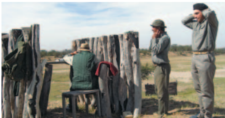
Einschießen ein Muss: Nach einem langen Flug werden die Waffen probegeschossen.