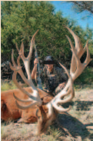
Gatterabschuss: In Argentinien kann man solche Hirsche schießen, aber in freier Wildbahn sind sie nicht groß geworden ...

„Unser Partner steht mit seinem guten Namen bereits seit vielen Jahren für ausgezeichnete Jagd ...“, hatte mir der Jagdvermittler geschrieben. Wegen verbotener