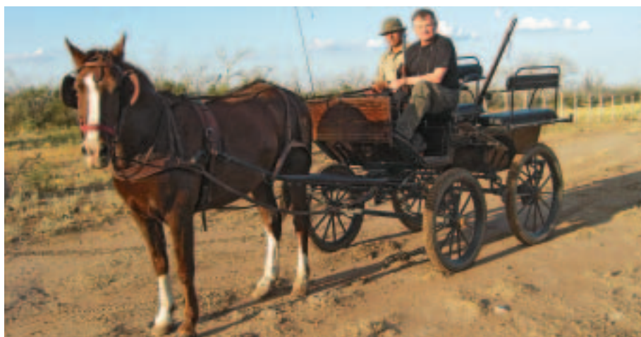
Entspannt auf Hirschjagd: Ganz traditionell geht es mit der Kutsche ins „grüne Meer“.