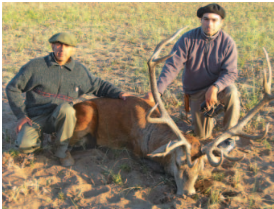
Typischer Pampahirsch: zwei Gauchos mit bravem Zwölfender

der Hirsche, vor allem nach Alter, Geweihmasse, Konstitution und Krone, vertraut gemacht. Das ist nämlich nicht selbstverständlich in Argentinien.