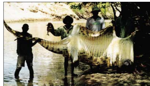
Krokodile haben in zwei Jahren 23 Menschen aus 12 Dörfern getötet und 55 verletzt, dafür bekamen die Mitgliedsdörfer von Jukumu Society einen Reduktionsabschluss, samt CITES-Bescheinigung für den Export der Krokodilhäute zugesprochen.

Nationale Richtlinien für diese kommunale Wildbewirtschaftung wurden vom Ministerium in Zusammenarbeit mit einem anderen Vorhaben der GTZ sowie einem von USAID finanzierten WWF-Projekt erarbeitet. In Kraft gesetzt wurde die Rechtsverordnung jedoch nur mit großer Verzögerung, da die Bürokratie ihre „Entmachtung“, der eine Stärkung armer Bevölkerungsteile gegenübersteht, nur sehr zögerlich betreibt. Der Staat wird deshalb weiterhin der Eigentümer des Wildes bleiben. Weder der Grad der Selbstständigkeit der Dörfer in Bezug auf die Wildwirtschaft noch ihr Anteil am Gewinn durch den Jagdtourismus wurden bis jetzt festgelegt. Dies zeigt, wie schwierig der gesamte Prozess in politischer Hinsicht ist und welcher weitere Weg noch zu gehen ist. Andererseits sind die Hemmnisse und Verzögerungen aber auch verständlich, denn mit diesen grundlegenden ordnungspolitischen Reformen wird das System von Wildschutz und Wildtiermanagement in wesentlichen Teilen verändert,