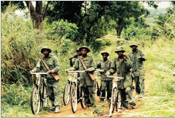
Entgegen dem ersten Anschein sind Fahrrad und Einbaum in der unzugänglichen Wildnis das schnellste und preiswerteste Fahrzeug für die Wildhüter