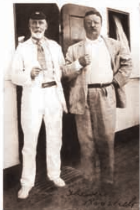
Selous organisierte zwar die Roosevelt-Safari, er begleitete den ehemaligen US-Präsidenten aber nur von Neapel nach Mombasa.

Das Bild (u.) stammt aus dem Familienalbum der Selous und zeigt das Grab bei Beho-Beho unmittelbar nach seinem Tod.