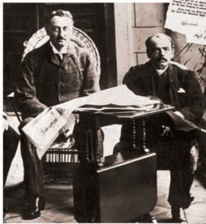
Cecil John Rhodes, damals noch Premierminister am Kap, und sein langjähriger Gefolgsmann Leander Starr Jameson auf Groote Schuur, dem Landsitz von Rhodes. Der Anstellungsvertrag (o. r.) mit Rhodes' British South Africa Company weist Selous als “Chief of Intelligence Staff“ (Chef des Nachrichtendienstes) aus.

Matabele und Mashona: 1893 kommt es zur unvermeidlichen Auseinandersetzung zwischen den Matabele und den rhodesischen Siedlern in Mashonaland. Selous schiffte sich nach Südafrika ein, nimmt an den Kämpfen teil und wird