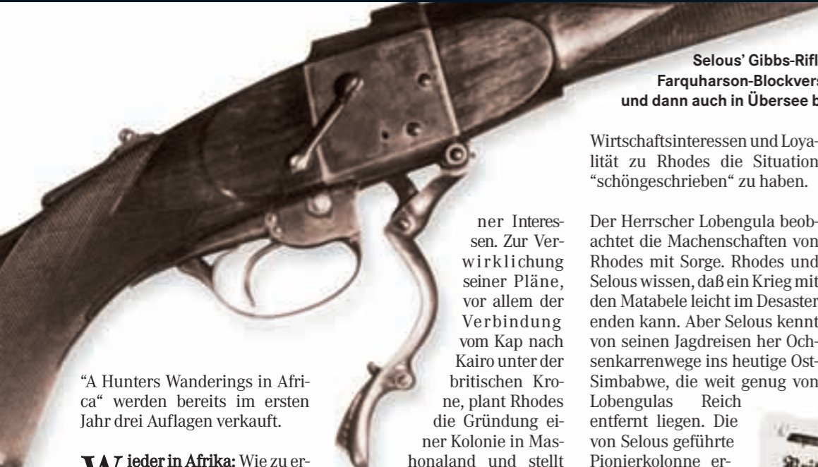
Selous' Gibbs-Rifle hatte den klassischen Farquharson-Blockverschluss. Sie war eine in England und dann auch in Übersee beliebte einschüssige Waffe.

“A Hunters Wanderings in Africa“ werden bereits im ersten Jahr drei Auflagen verkauft.