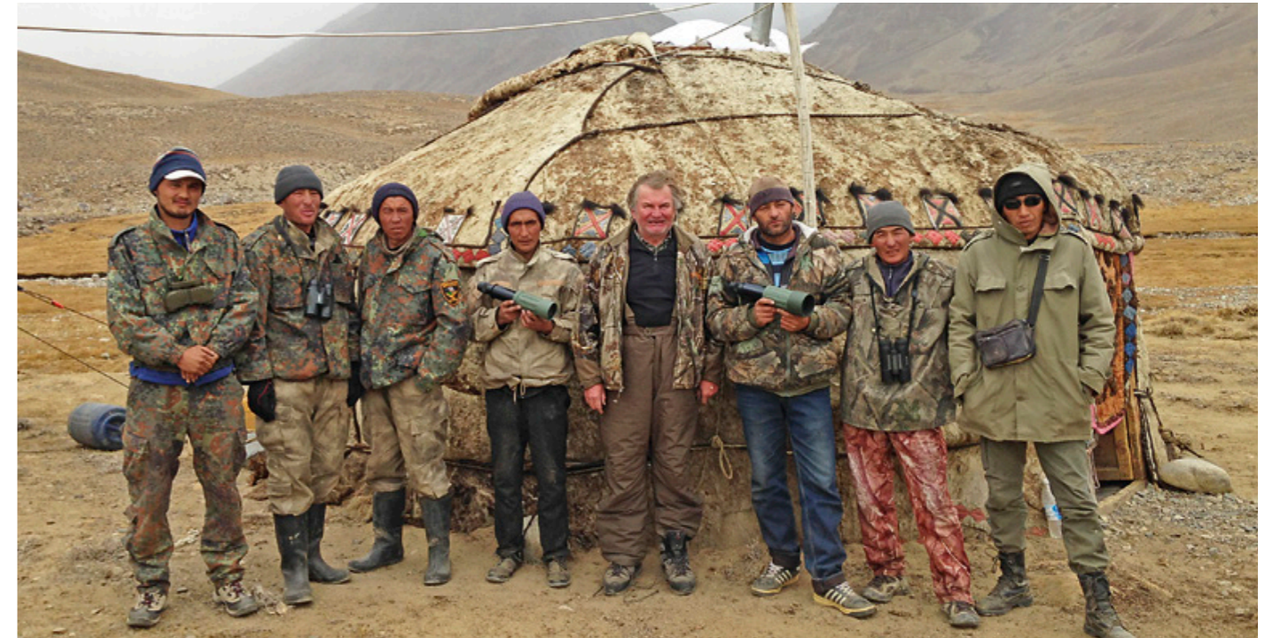
Und immer wieder wird nach Steinwild Ausschau gehalten (oben). Frühstück am Berg (re.) Kapitaler Markhor (re. unten)