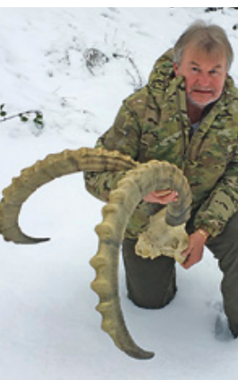
Die erfolgreiche Steinbockjagd im kargen, weitläufigen Pamir verdient sein.

mich das im Deutschen auch «Grunzochse» genannte Rindvieh über Stock und Stein, durch vereiste Flüsse und an steilen Hängen entlang. Durch die Nase war ein Strick geführt und an diesem dirigierte ich ihn – ganz Herrenreiter – entweder selbst, oder ein Helfer zog uns hinter sich her. Nur wenn wir ihn manchmal nachts am Berg allein zurückliessen, tat er mir leid. Er wurde dann nämlich mit einer Flasche Benzin abgespritzt und eingerieben, damit ihn die Wölfe in Frieden liessen.